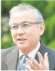
■岐阜聖徳学園大学